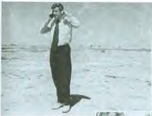
تدقيق ميداني في أثناء التوقف لإعادة التزود بالوقود في قاعدة بَلد الجوية شمال بغداد